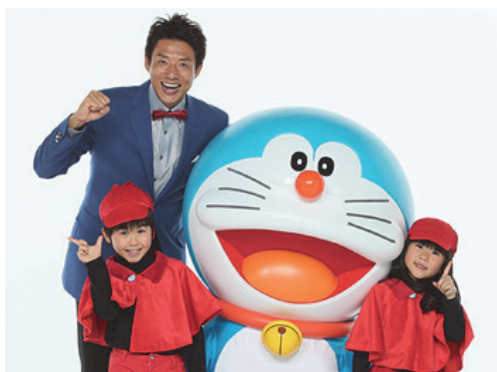
ドラえもんとおうえんだん 応援団